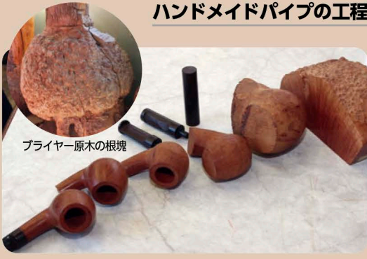
ブライヤー原木の根塊